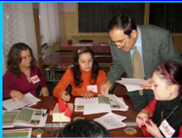
"Școala care învață"