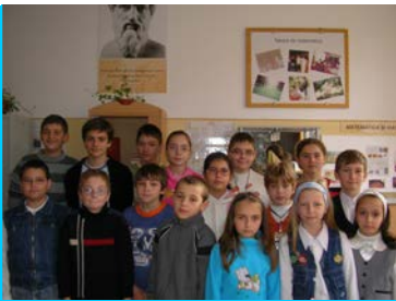
Concursul de matematică SIM 2007

În perioada 25-28 octombrie 2007 a avut loc în cadrul Zilelor Matematicii Băcăuane concursul de matematică SIM 2007 , găzduit de școala noastră, unde au participat un număr de 468 de elevi din toată țara, fiind premiați un număr de 228 elevi. 15 elevi (foto) din școala noastră au obținut diferite premii și mențiuni.