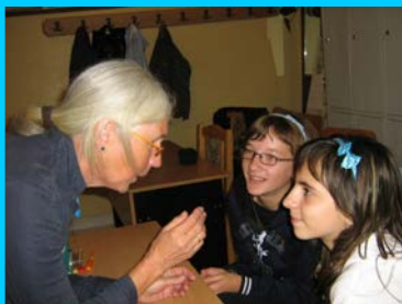
Doi englezi în școala noastră...

Impresiile făcute se vor materializa într-o viitoare corespondență între elevii școlii noastre și elevii unei școli din orașul în care locuiesc.