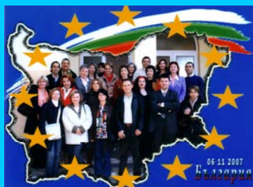
Proiect Comenius I în Bulgaria

Mulțumim încă o dată sponsorilor (enumerați pe ultima pagină) care ne-au sprijinit la finalizarea bustului!