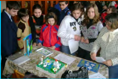
Ziua Mondială a Zonelor Umede

Pertru acordarea burselor pe semestrul al II-lea se vor depune dosare la Comisia de evaluare a școlii (acestea vor fi aprobate de Consiliul de administrație). Elevii vor depune o cerere tip, adeverință cu media de intrare, media generală semestrială având un procent de 75% iar în funcție de gradul de implicare în activitățile extracurriculare se vor aloca 25%; adeverințe de la profesorii-coordonatori ai activităților extracurriculare (din școală sau din afara școlii) și obligatoriu media 10 la purtare.