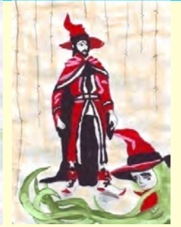
Timofte Matei 4A