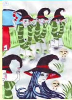
Timofte Matei 4A