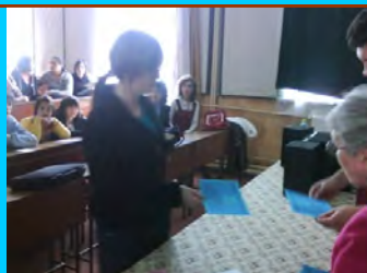
Prima ediție a campionatului de ortografie “Grigore Vieru”

Mulțumim comitetului de părinți pentru implicarea în activitățile școlii ori de câte ori a fost nevoie!