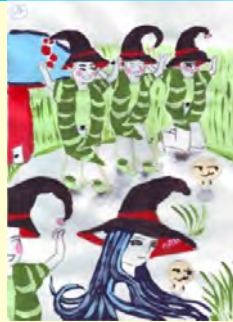
Timofte Matei 4A