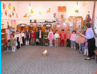
Serbare la grădiniță