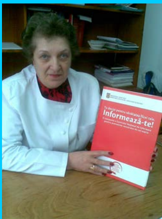
Campania de vaccinare