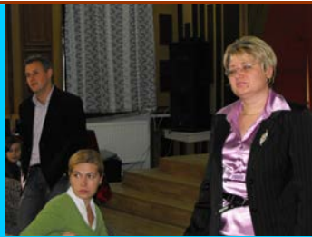
Proiect multicultural la Colegiul Pedagogic