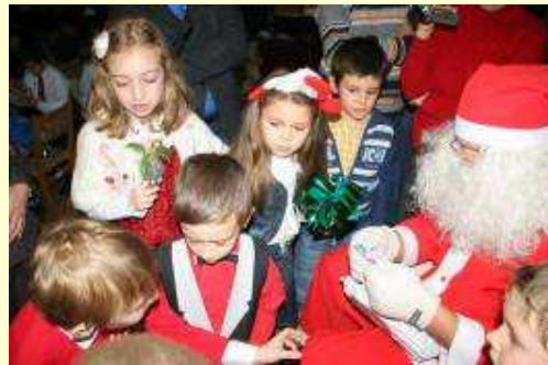
La clasa întâi...