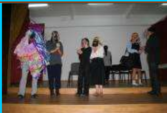
Universitatea “Vasile Alecsandri” din Bacău ne oferă o piesă de teatru în limba franceză