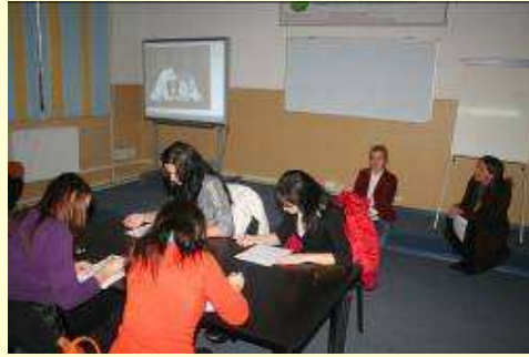
Limba franceză (concurs de dictare, colinde în limba franceză)