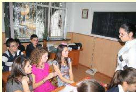
Piesă de teatru realizată de elevi...