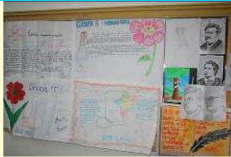
La limba și literatura română...