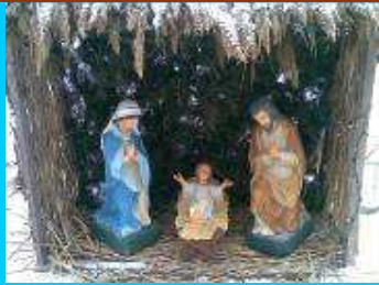
Serbări de Crăciun...