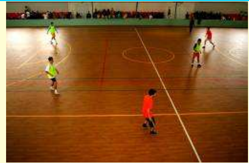
La educație fizică și sport...