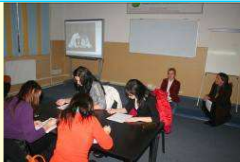
Limba franceză (concurs de dictare, colinde în limba franceză)