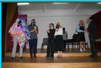
Universitatea “Vasile Alecsandri” din Bacău ne oferă o piesă de teatru în limba franceză